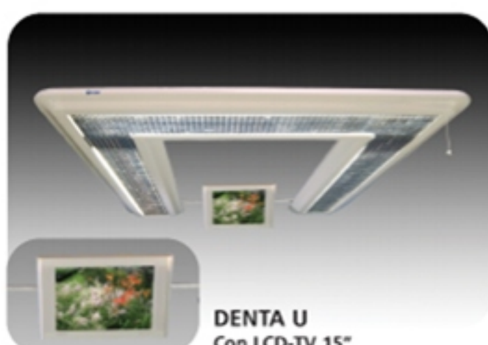
DENTA U Con LCD-TV 15"

Los dentistas tienen un problema especial, sus ojos están constantemente cambiando entre intensidades de luz (contraste), la luz de la lámpara de operaciones y la periférica (entorno), siendo esta última, bastante más débil.